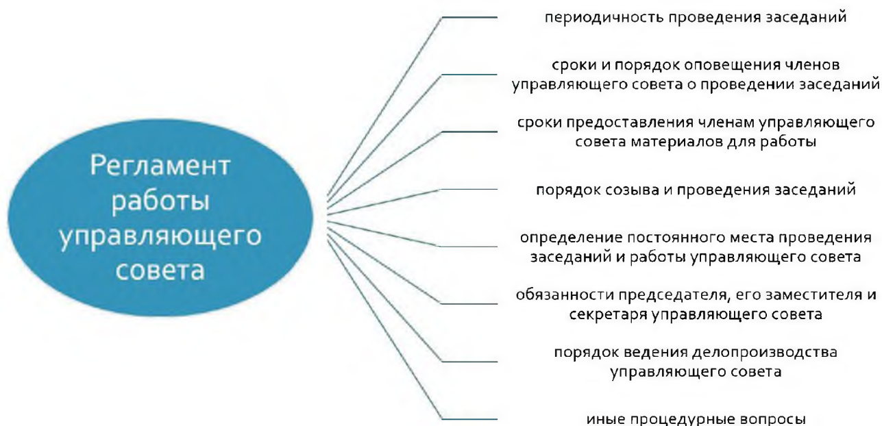
Рисунок 3 – Регламент работы управляющего совета

Для более подробной регламентации процедурных вопросов порядка своей работы управляющим советом разрабатывается и утверждается регламент работы управляющего совета (рисунок 3) [23].