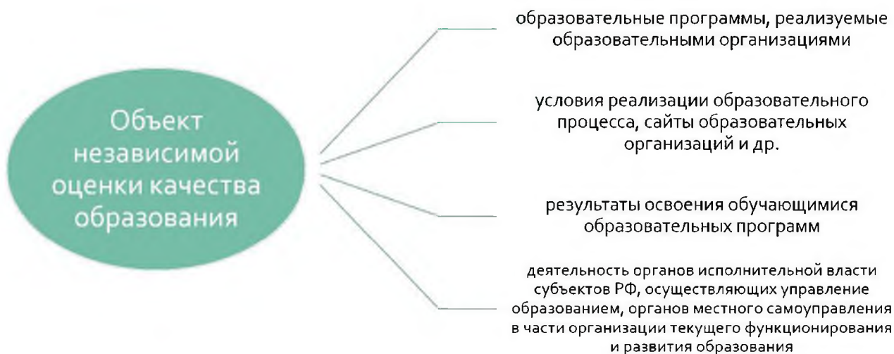
Рисунок 5 – Объекты независимой оценки качества образования

На уровне региона, муниципального образования также может быть востребована сравнительная оценка (рейтинг) образовательных организаций.