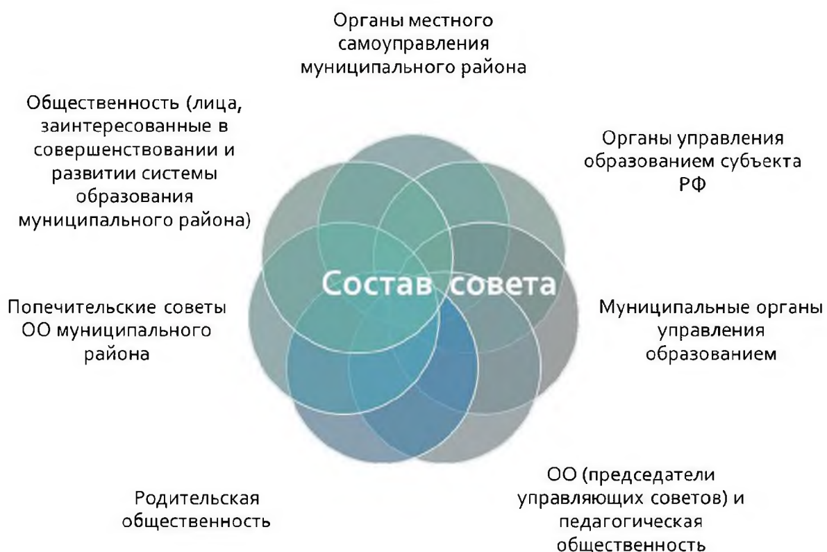
Рисунок 4 – Состав совета

районное родительское собрание; районный совет старшеклассников муниципального района; районная ученическая конференция; совет председателей управляющих советов; управляющий совет малокомплектных сельских школ; управляющий совет системы образования муниципального района.