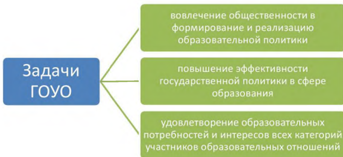
Рисунок 1 – Задачи ГОУО

Выделены три основные задачи ГОУО, показанные на рисунке 1.